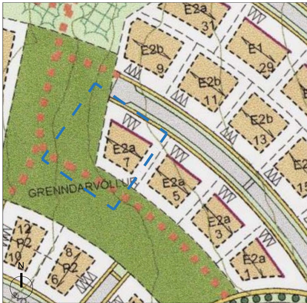
Fyrir breytingu M 1 : 1000 Uppdráttur er fengin úr gildandi deiliskipulagi samþykktu í bæjarstjórn Hafnarfjarðar þann 26.10.1999