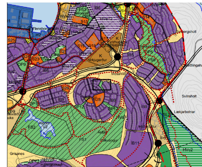
Hluti af Aðalskipulagi Hafnarfjarðar 2013-2025

Að öðru leyti gilda skipulagsskilmálar fyrir Ásland 2. áfanga, úgáfa 0.7 dags. 19.02.02