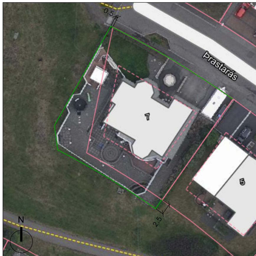
Lofmynd úr skipulagssjá með breyttum lóðamörkum